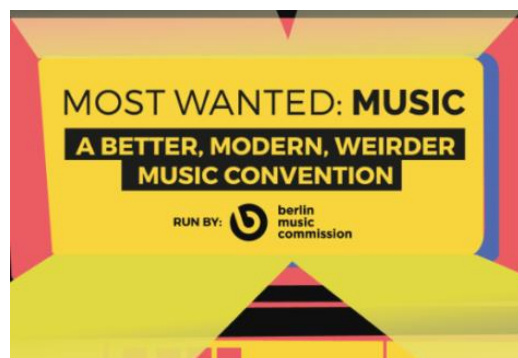
#6 BERLIN MUSIC COMMISSION