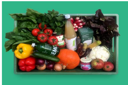
#2 BIOKISTE HAMBURG