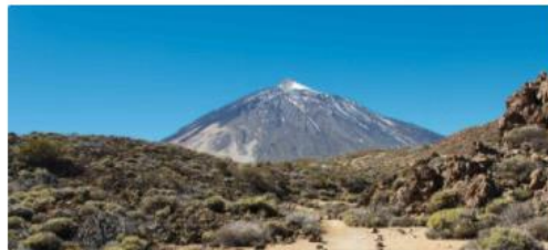
Pico del Teide auf Teneriffa

Teneriffa ist nicht nur die größte Insel der sieben Kanarischen Inseln, sondern auch die bevölkerungsreichste Inseln Spaniens sowie eines der beliebtesten Reiseziele in Europa. Fünf Sinne reichen kaum aus, die atemberaubende Vielfalt der kanarischen Inselschönheit zu entdecken, deren Natur und Kultur facettenreicher kaum sein könnte!