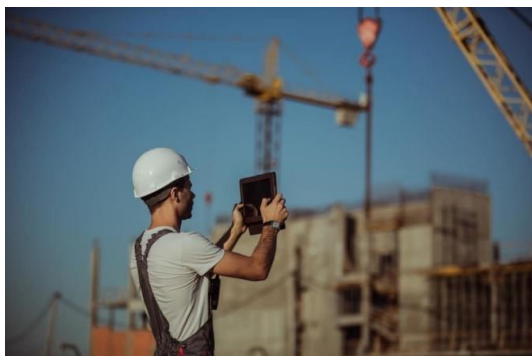
#3 CAPMO GMBH