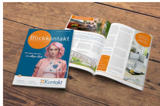
#4 WGB KONTAKT E.G.